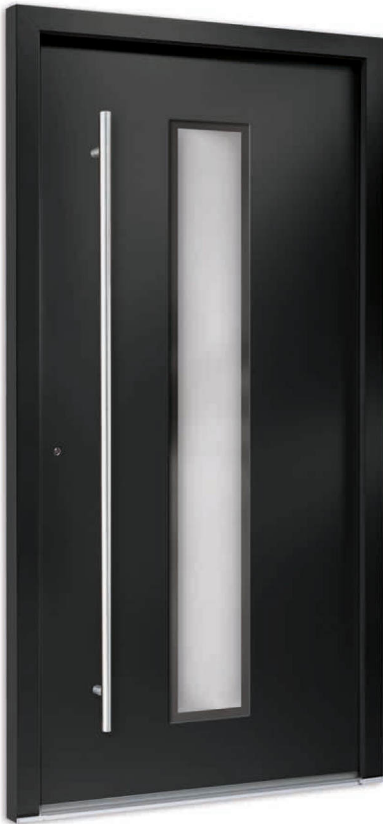
Modell 7740-50 | Farbe: RAL 7016 anthrazitgrau | Glas: G 500-25 mattiertes Glas mit klarem Rand | Aufsatzfüllung | Mit 1600 mm Edelstahl-Stangengriff