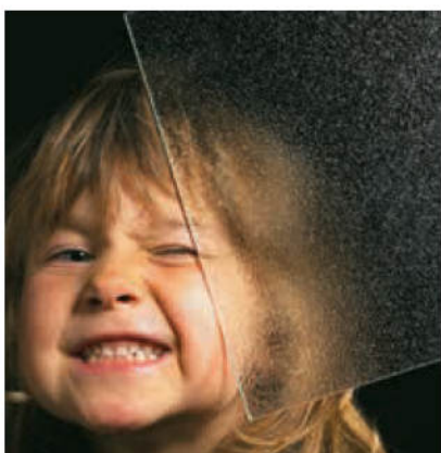
Ornament 504 weiß