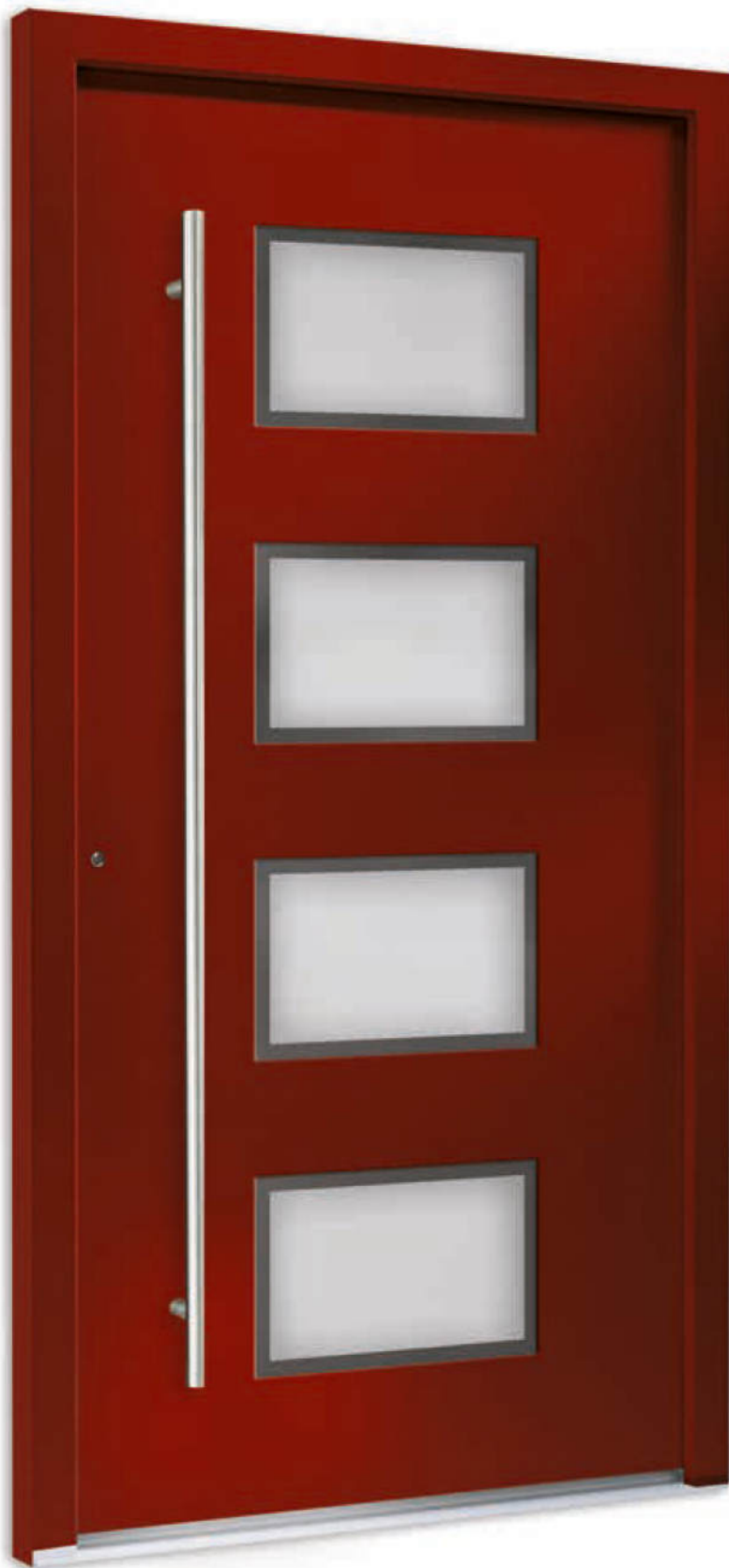
Modell 7750-50 | Glas: G 500-25 mattiertes Glas mit klarem Rand | Farbe: RAL 3004 purpurrot | Auf- satzfüllung | Mit 1600 mm Edelstahl- Stangengriff