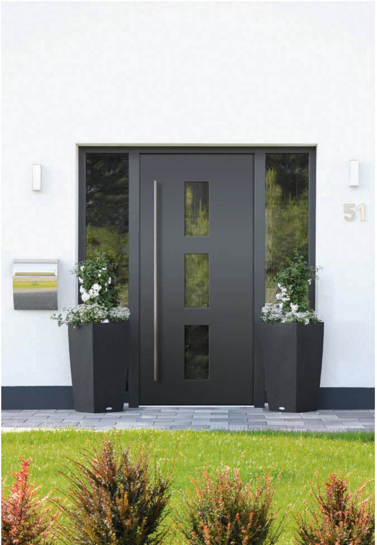
Modell 7745-50 mit Ganzglas-Seitenteilen | Farbe: RAL 7016 anthrazitgrau | Glas: Klarglas | Aufsatzfüllung | Mit 1600 mm Edelstahl-Stangengriff