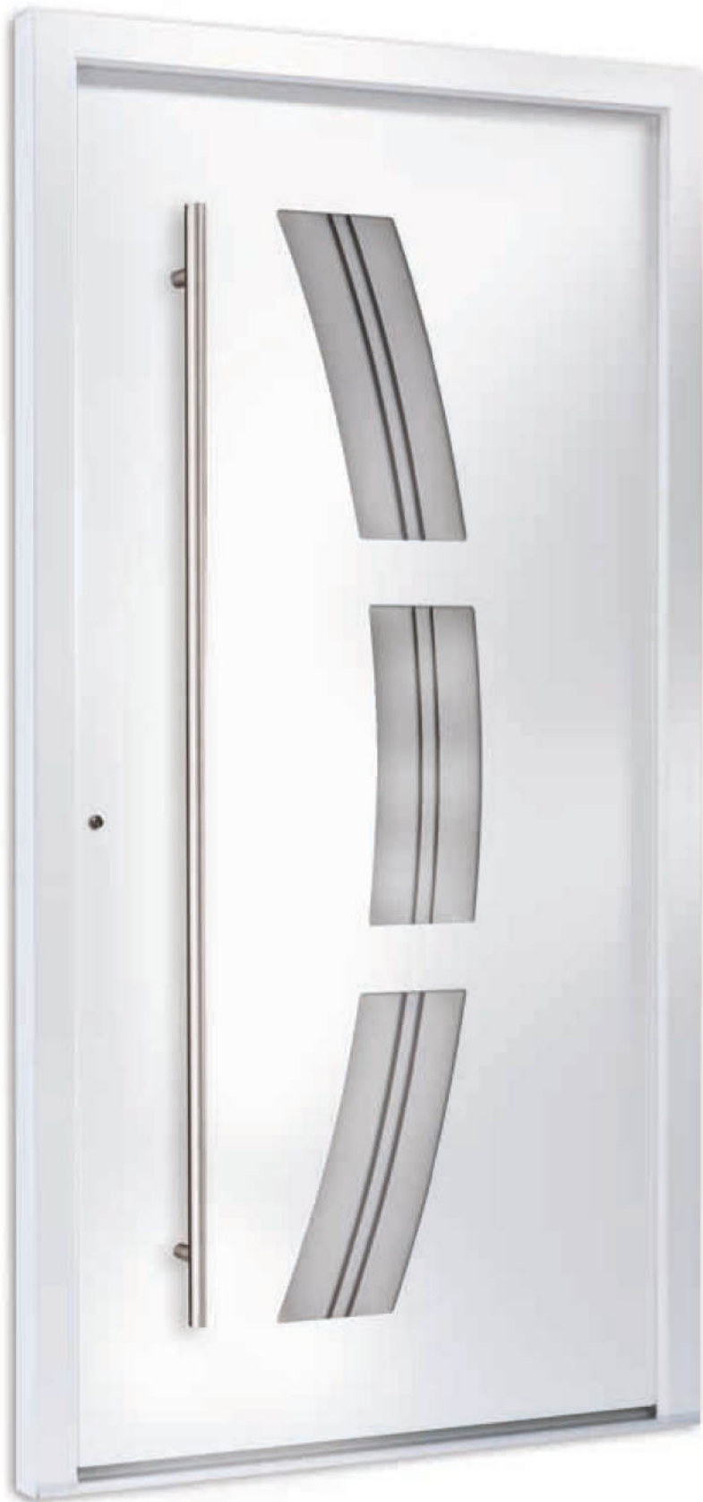
Modell 7748-50 | Glas: G 1310 mattier- tes Glas mit klaren Streifen | Aufsatz- füllung | Mit 1600 mm Edelstahl-Stangengriff