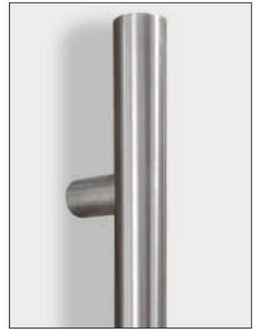
Integrierter Edelstahl-Stangengriff in verschiedenen Längen 400 mm bis 2000 mm erhältlich