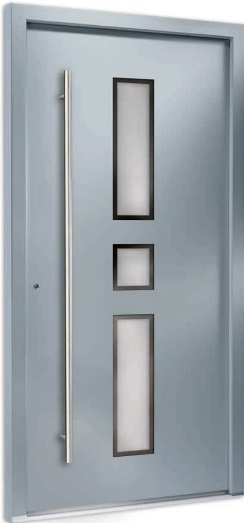
Modell 7751-50 | Farbe: RAL 7001 silbergrau | Glas: G 500-25 mattiertes Glas mit klarem Rand | Aufsatzfüllung | Mit 1600 mm Edelstahl-Stangengriff