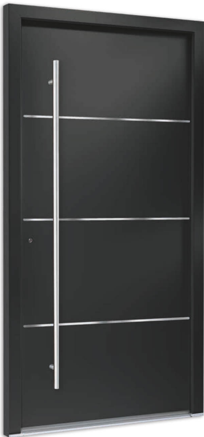
Modell 7730-94 flächenbündige Lisenen Farbe: RAL 7016 anthrazitgrau | Aufsatzfüllung | Mit 1600 mm Edelstahl-Stangengriff