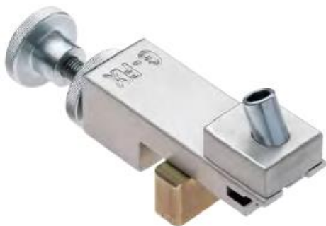
G-FIX Montagelehre zur Direktmontage